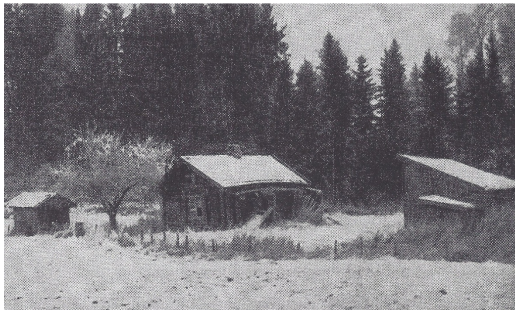
Sørlistua i 1961