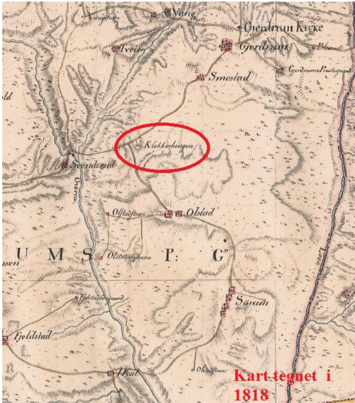
Kart tegnet i 1818