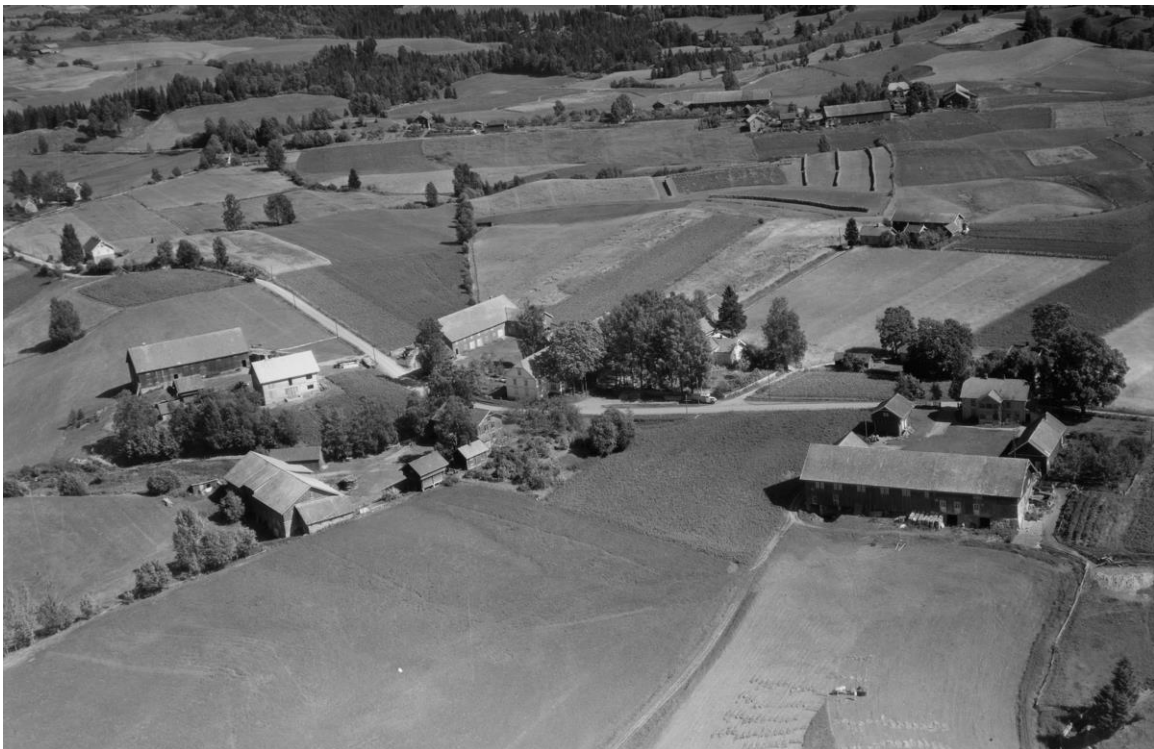
Sandumsgårdene. Meieriet syns oppe til venstre.