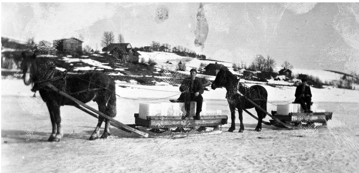
Transport av is fra Nitelva ca. 1940.