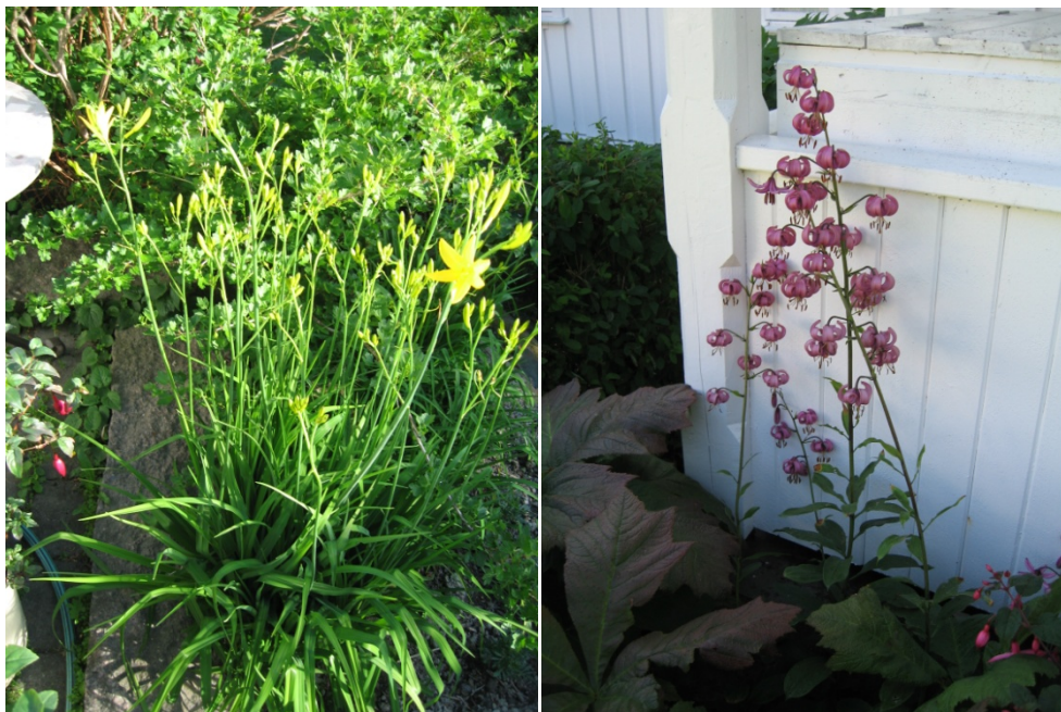
Til Venstre: Daglilje. Til høyre: Martagonlilje.

På oldemors tid ble det også plantet trær mellom stabburet og hovedbygningen i lia ut mot veien. Det var hestekastanje, bjørk og lønn. Dette skjedde rundt 1920, for vi ser de nyplantete trærne på fotografier fra denne tida. Så ble en granittsøyle gravd ned i bakken mellom trærne, og en gammel møllestein plassert oppå. Dermed hadde de et bord. Rundt dette ble det støpt heller og satt benker. Området ble så døpt parken, og dette navnet bruker vi fortsatt.