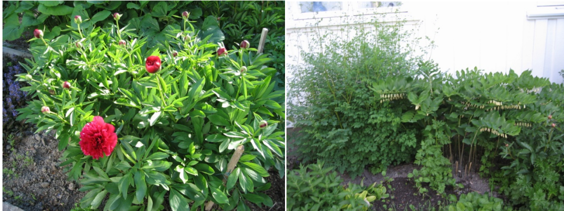
Til venstre: Peon. Til høyre: Frøstjerne og kantkonvall.

På noen gamle fotografier fra omkring 1920 ser vi også at det var anlagt blomsterbed. Det er vanskelig å se hva som sto i disse blomsterbedene. Men gamle stauder har levd her på gården fra generasjon til generasjon, og det er svært sannsynlig at det er disse vi aner på de gamle fotografiene. Da jeg vokste opp, hadde oldemor allerede i mange år bodd i kårboligen som også hadde en have med grusganger, trær og bed på østsiden av tunet. Blant de staudene hun hadde var peonrose, daglilje, kyssmegovergjerdet, kantkonvall, løytnantshjerte, martagonlilje, frøstjerne og skogskjegg. Alle disse staudene har vi tatt vare på, men de er plantet om på andre steder.