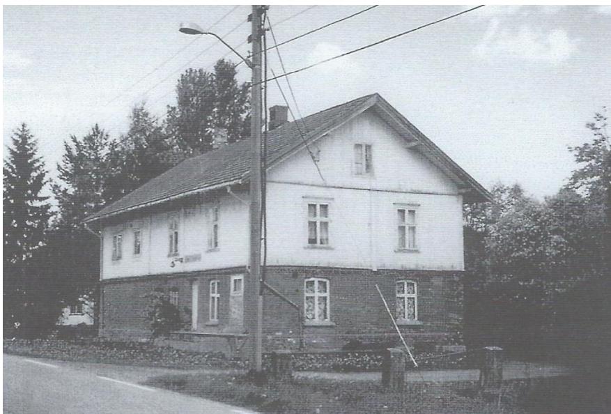
Kjærstadmeieriet kopiert fra bygdebokas bind 4. Bygget har 150m 2 grunnflate. 1.etg. av murverk hadde 5 ulike rom som ble brukt i meierivirksomheten. 2.etg. i tre inneholdt meierisalen og to leiligheter på hhv. ett og to rom pluss kjøkken. Bygget står der fortsatt.

Enda en endring kom i 1947. Da ble Kristiania Melkeforsyning og Kristiania Meieribolag slått sammen til A/L Fellesmeieriet. (Se evt. bygdeboka bind 4, s.286-293 ang. dette.)