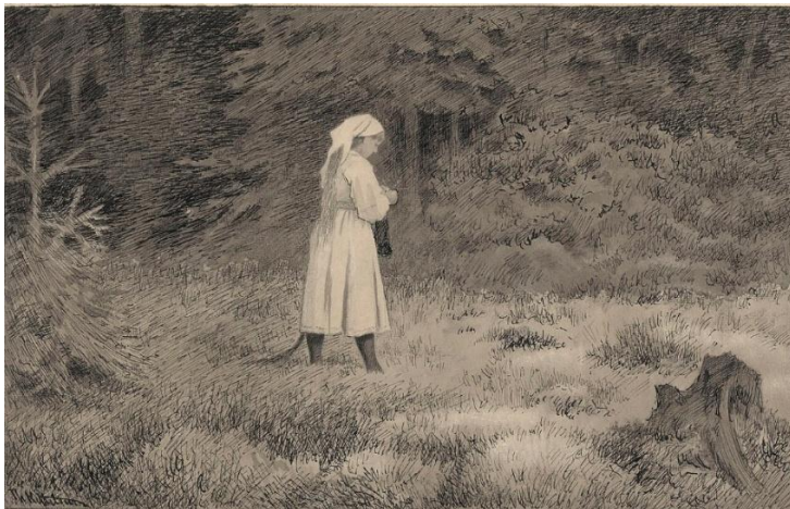
Theodor Kittelsens (1857-1914) tegning av ei hulder i 1892. Obs. bindingen og halen.