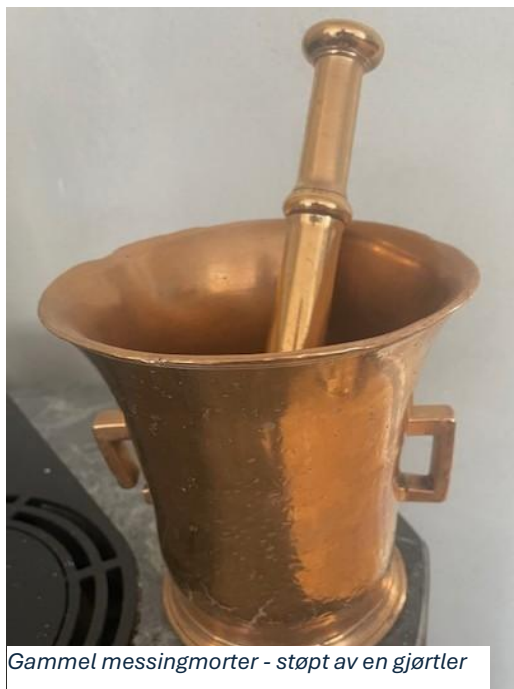
Gammel messingmorter - støpt av en gjørtler