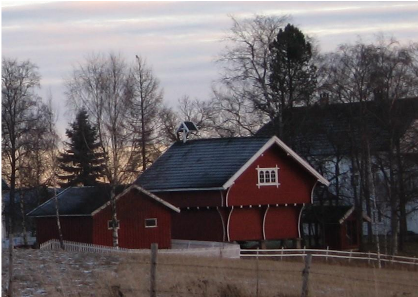
Det «nye» stabburet fra 1927 med klokketårn, men uten klokke, fotografert i 2016.

Østre Åmot november 2018 Tor Laache, Gjerdrum Historielag