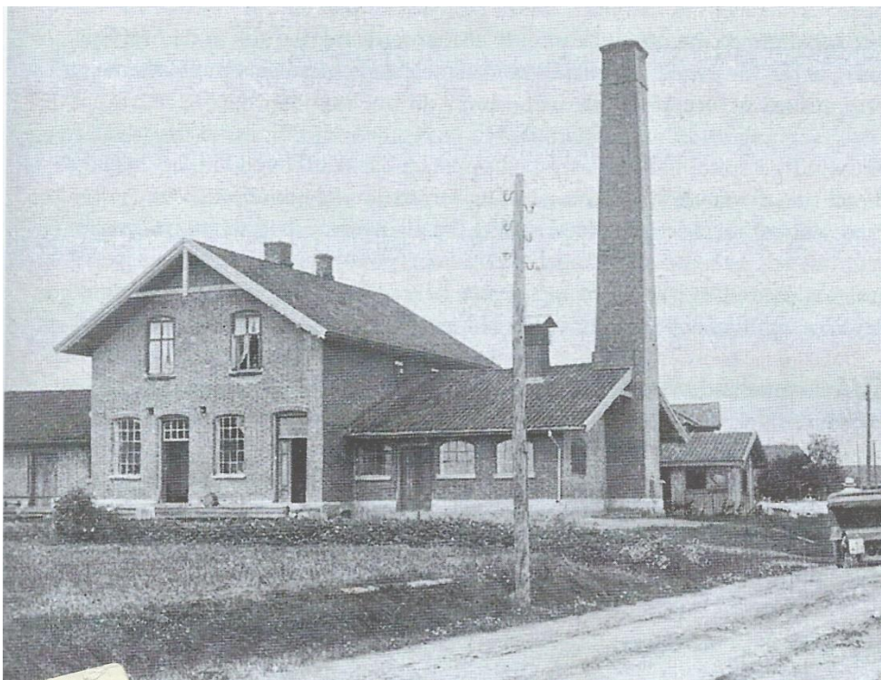
Hønsimeieriet