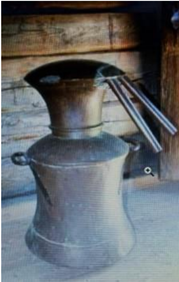
Brennvinskjele fra 1800-tallet